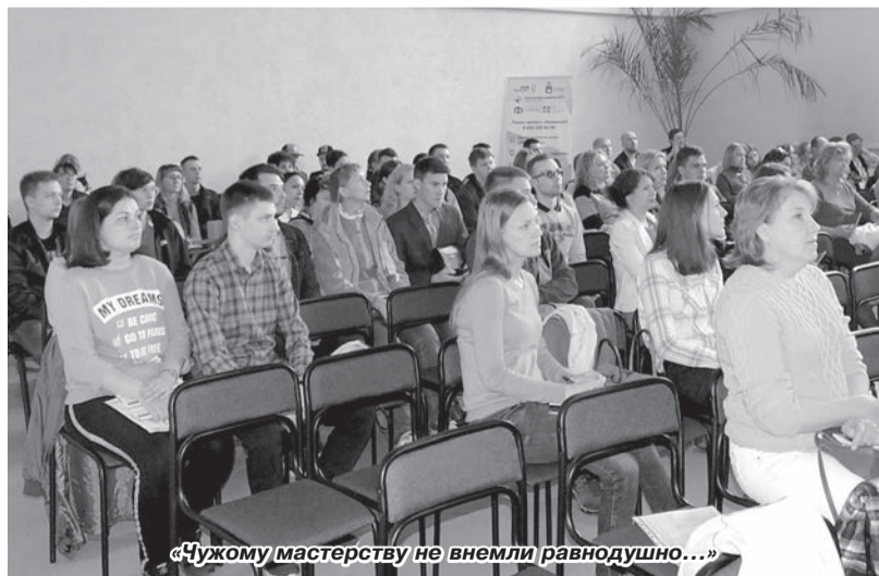
«Чужому мастерству не внемли равнодушно...»