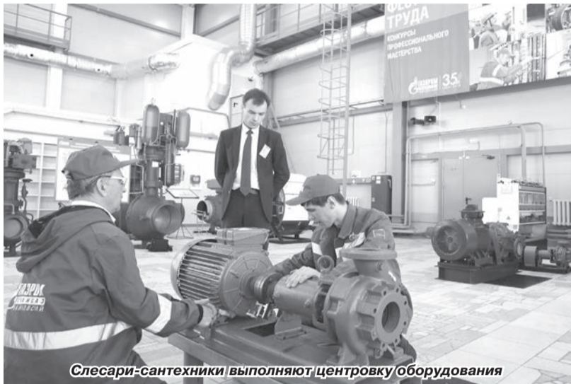
Слесари-сантехники выполняют центровку оборудования

Под занавес мая в Чайковском прошёл Фестиваль профессионального мастерства, посвящённый 35-летию со дня образования ООО «Газпром трансгаз Чайковский».